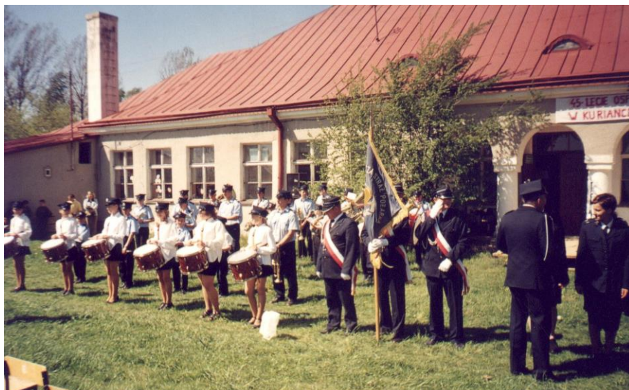
Orkiestra Dęta OSP w Lipsku, w trakcie jubileuszowego koncertu.