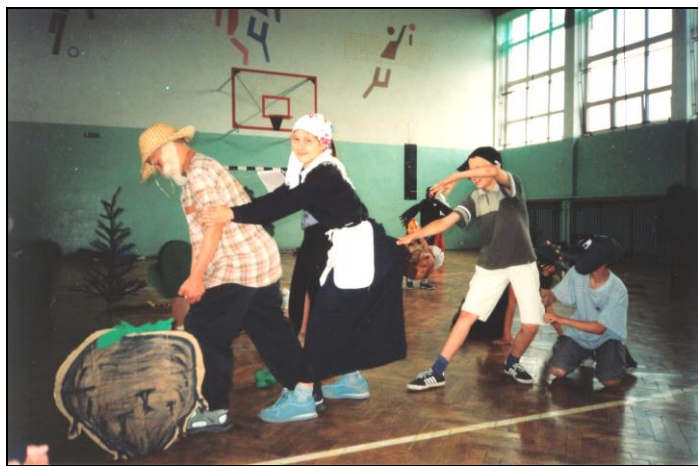
Czy uda się wyciągnąć rzepkę?