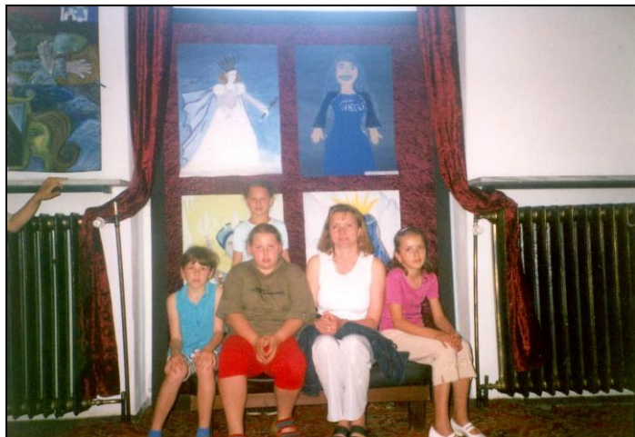
W antrakcie przedstawienia „Królowa Śniegu