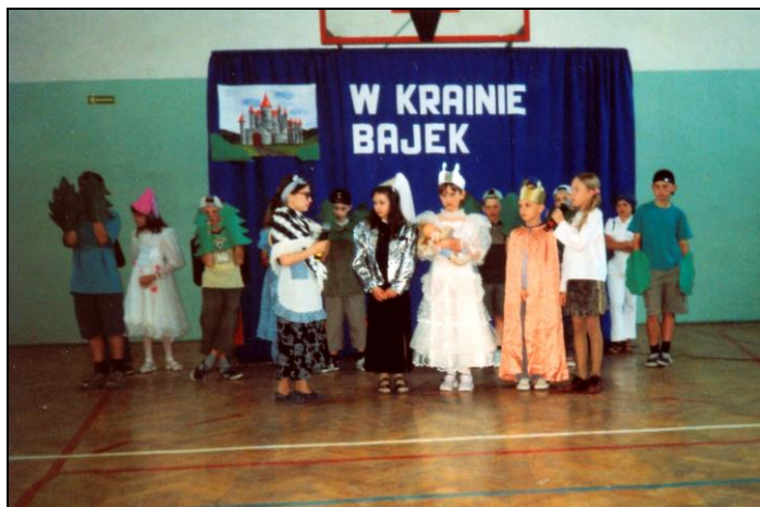
W krainie bajek wszystko zdarzyć się może...

Wakacje to czas zasłużonego wypoczynku, warto jednak powrócić do wydarzeń minionego roku szkolnego, tym bardziej, że w szkole podstawowej działo się naprawdę wiele.