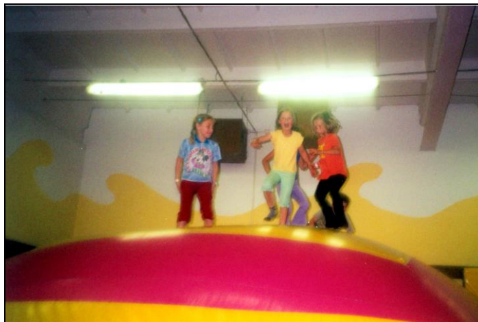
Zabawa na całego w Fikolandzie