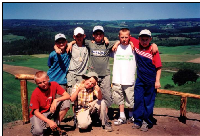
Zdobywcy Góry Cisowej