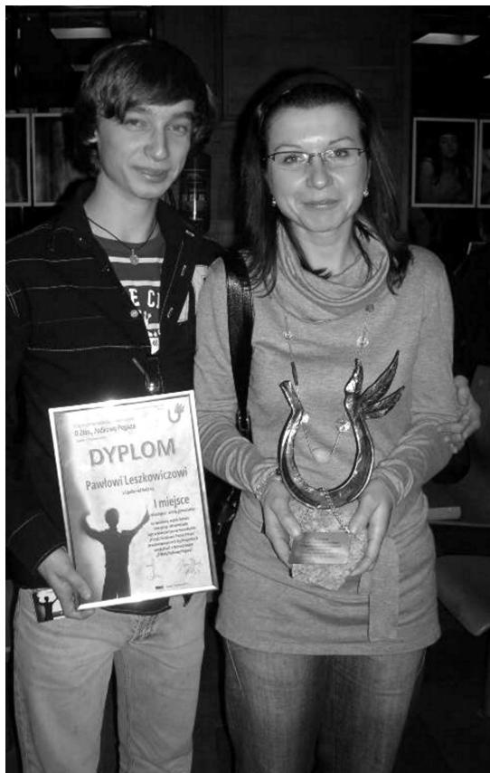
Zwycięzcy już po ogłoszeniu werdyktu jury.

AD PERPETUAM REI MEMORIAM Na wieczną rzecz pamiątkę.