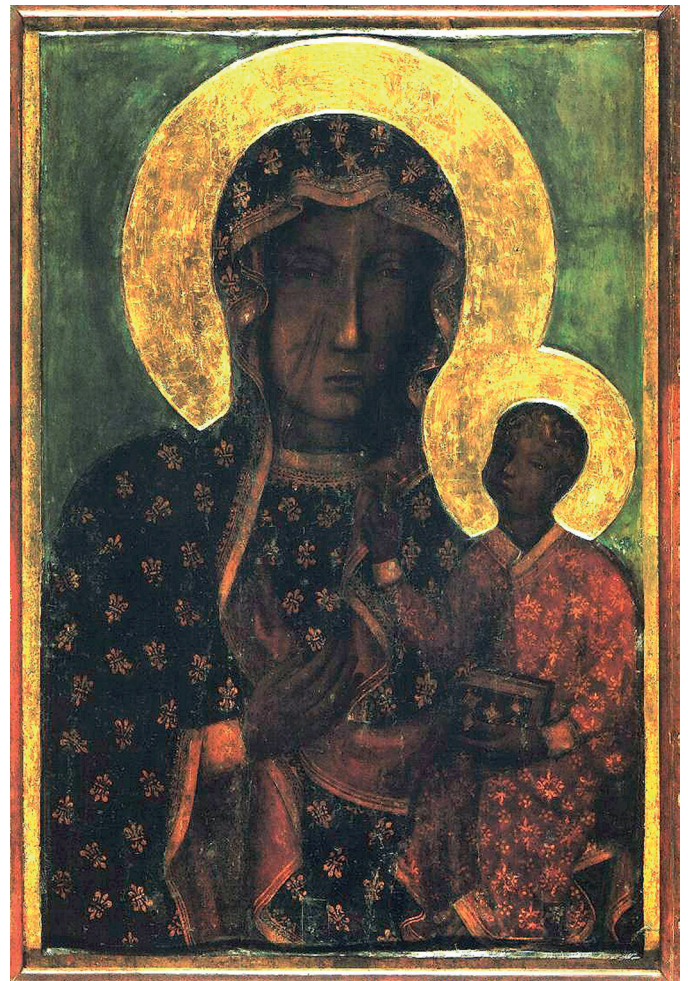
Obraz Matki Boskiej Częstochowskiej