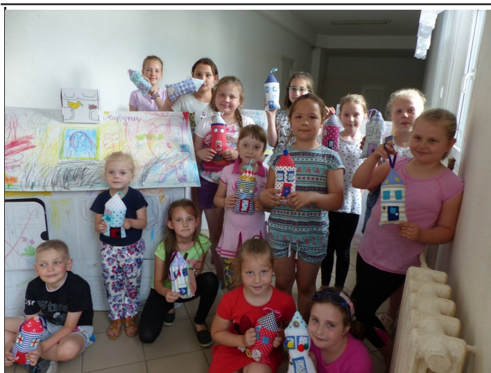
10 czerwca 2017 r. w ramach zadania zleconego „Aktywna Rodzina” finansowanego z budżetu Urzędu Miejskiego w Lipsku, odbyły się warsztaty szycia przytulanelek - domków wraz z firmą „Ala ma kota”

Uprzejmie przypominamy, że składka członkowska na rok 2017 pozostaje bez zmian i wynosi 25 zł za rok!